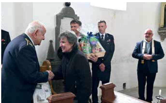
Svátek sv. Floriána