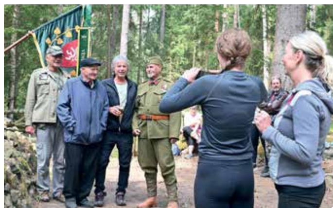
Zahájení sezóny v Muzeu lehkého opevění