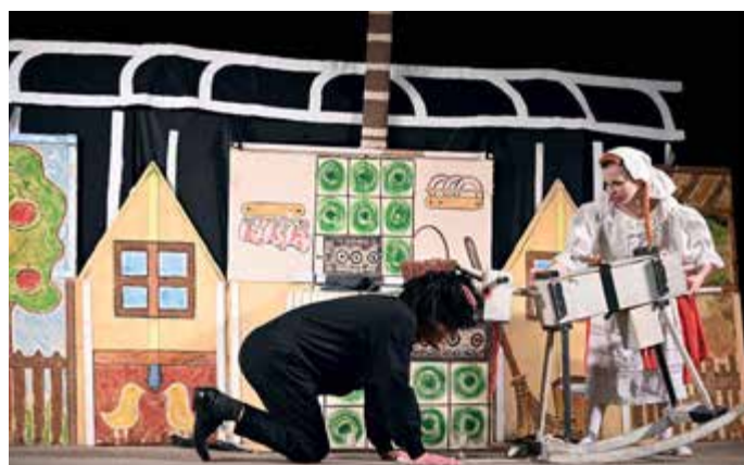
Čert a Káča