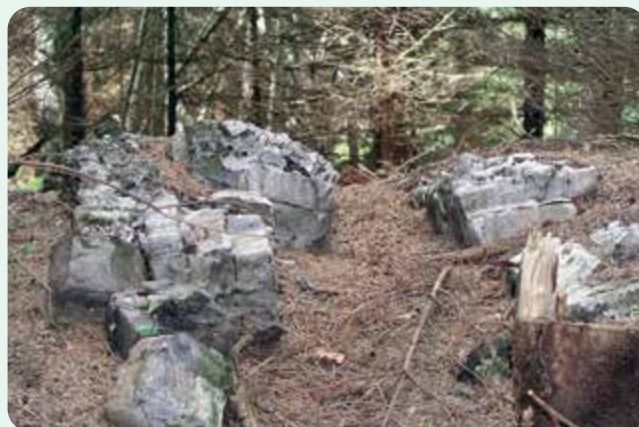
Stopy sklářství v terénu