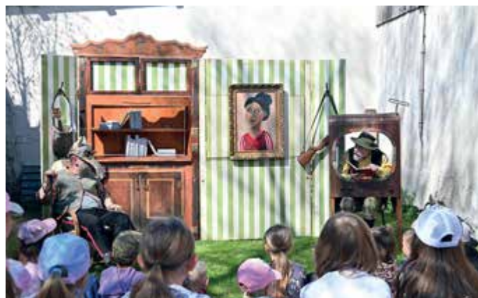
Vyprávění starého vlka