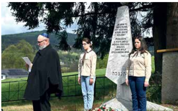
Pietní akt na židovském hřbitově