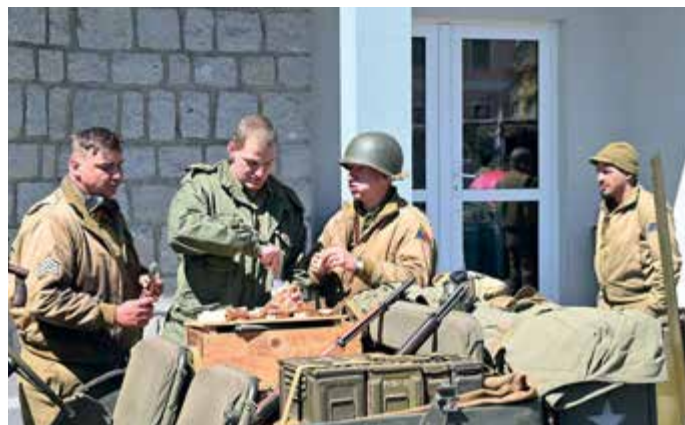
81. výročí konce druhé světové války